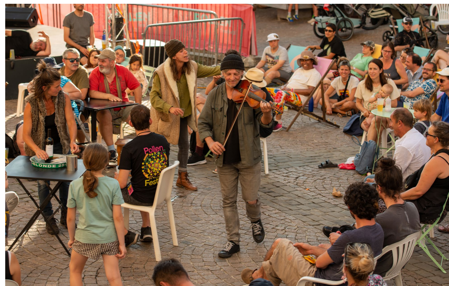
↑ La Folle Avoine ↗ Cie Digestif