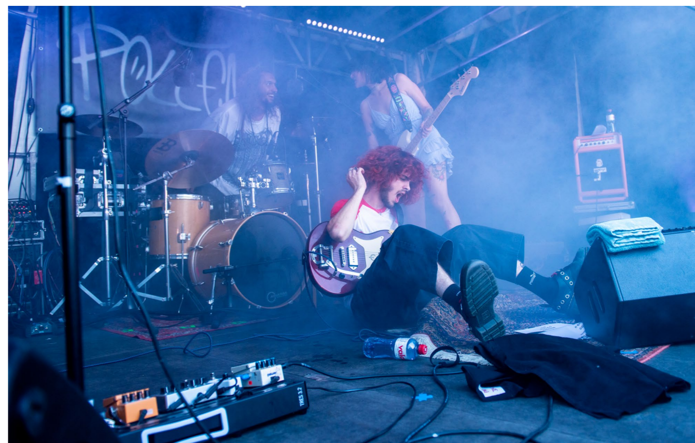
↑ Crème Solaire ↗ The Toksins