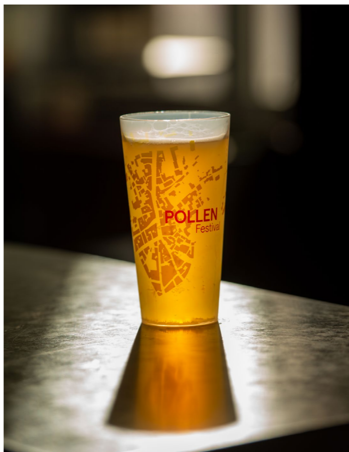
↑ Affiche 2025 ➤ Nouveaux verres