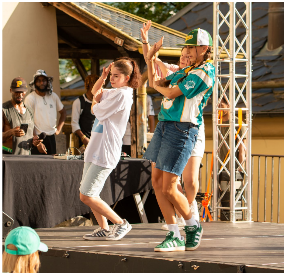
↑ L'esprit du cercle