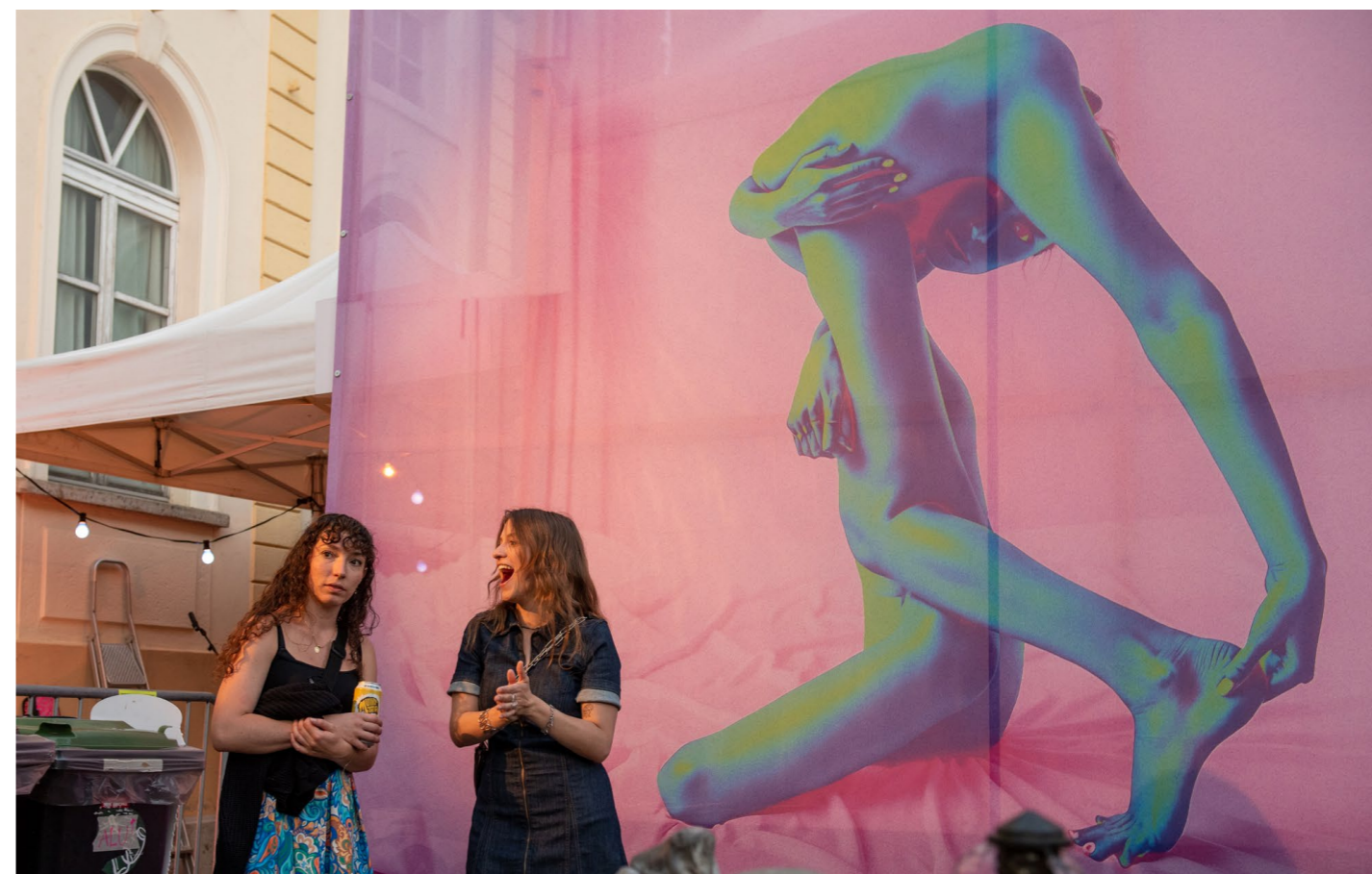
↑ Collectif ACA

La Place des Théâtres a été pensée comme un espace ouvert, mouvant et modulable, offrant des expériences sensibles, immersives et accessibles, et créant des points de rencontre entre les œuvres, les pôles, les lieux et les publics.