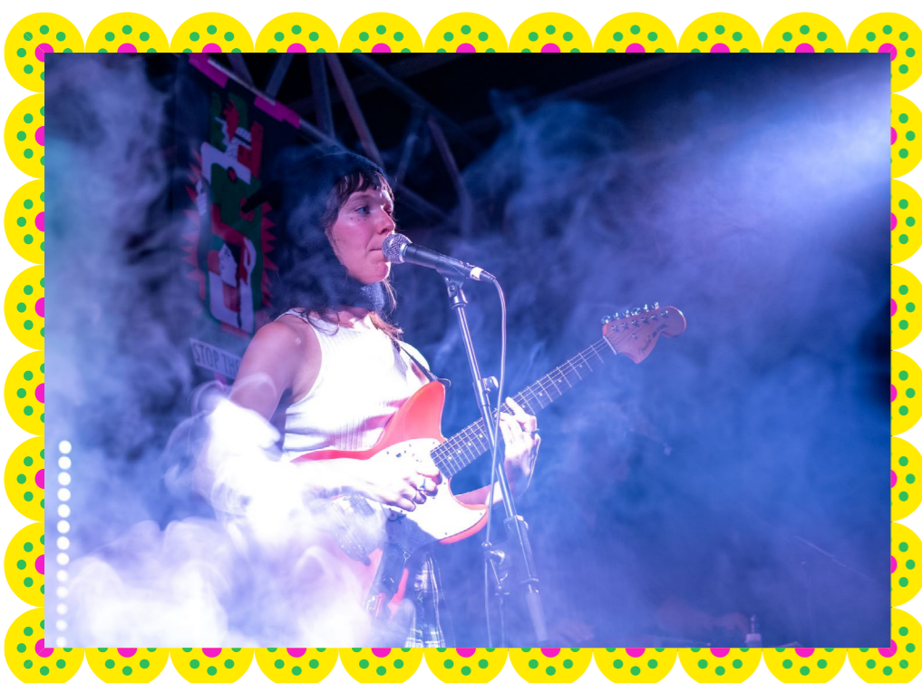
← 24 Kiara ↓ El Mizan